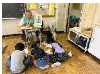
3年生の地域の方と交流