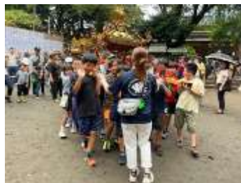
祭りの神輿と祭りで披露したダンスクラブ